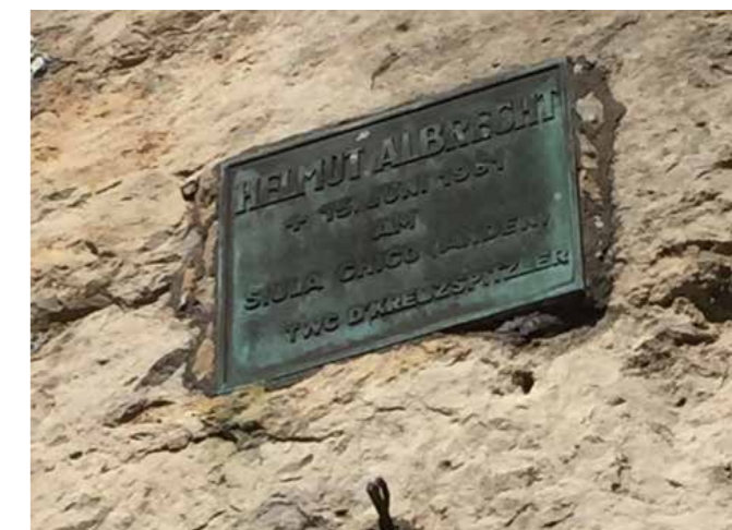
Gedenktafel für Helmut Albrecht