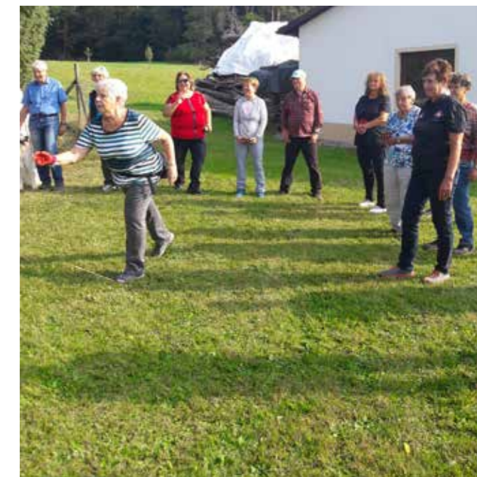
Starzelmeisterschaft in Waller