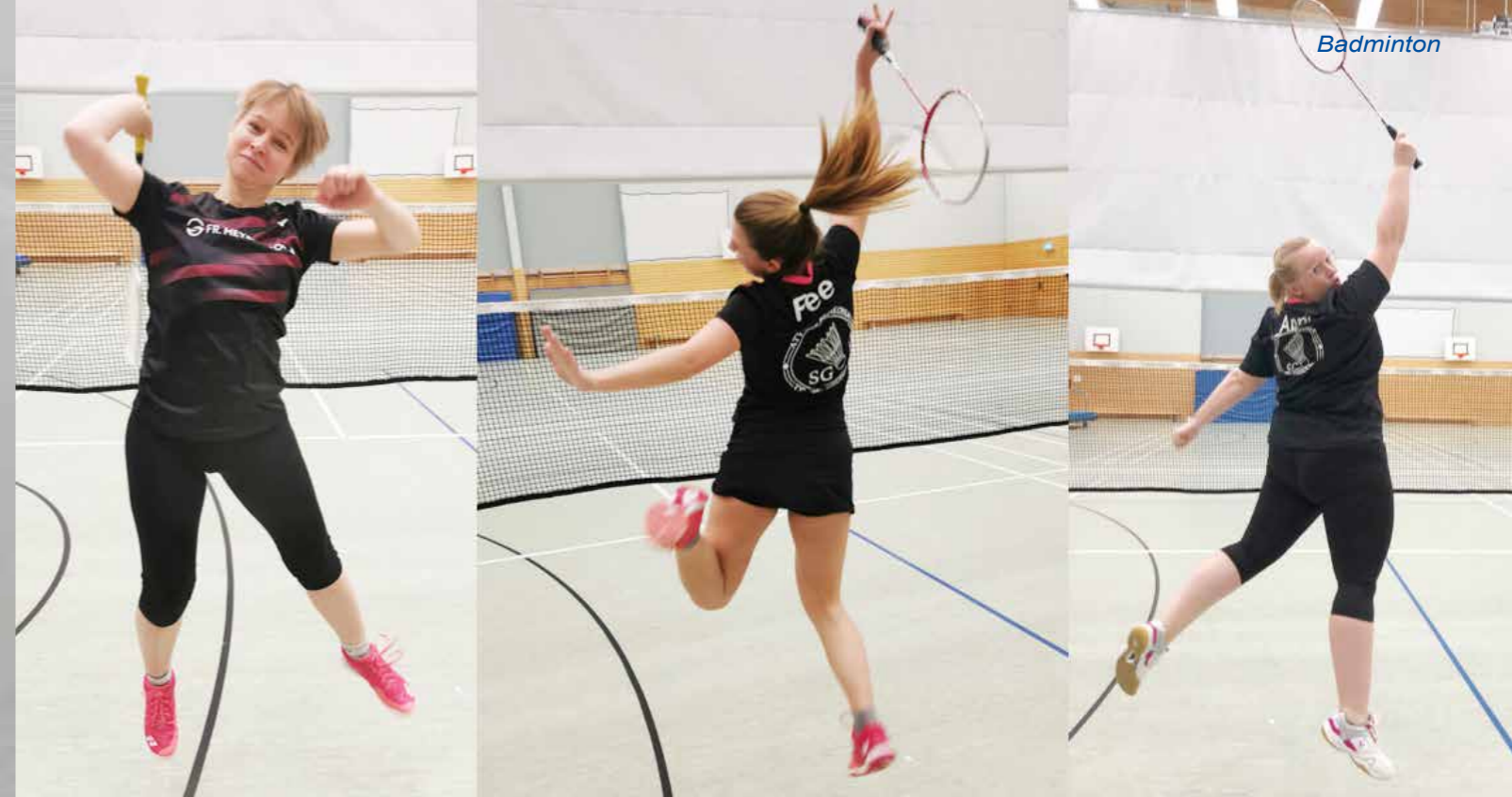
Luftsprünge vor Freude über die neuen Trikots