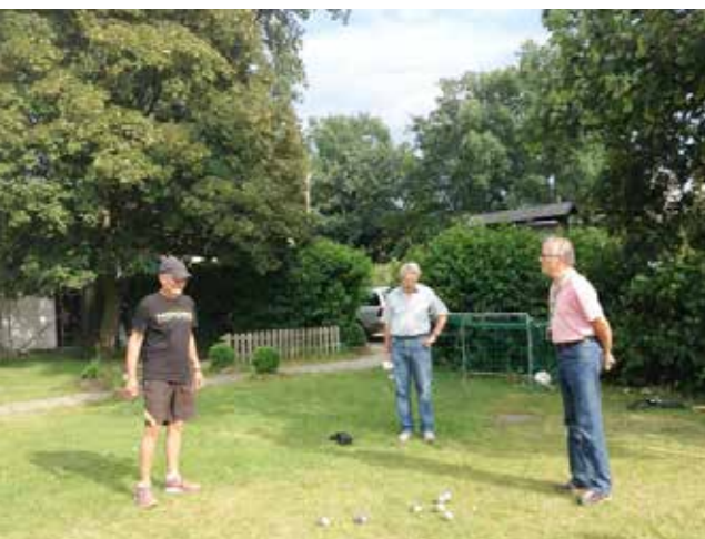
Beim Boule: welche Kugel liegt am besten?