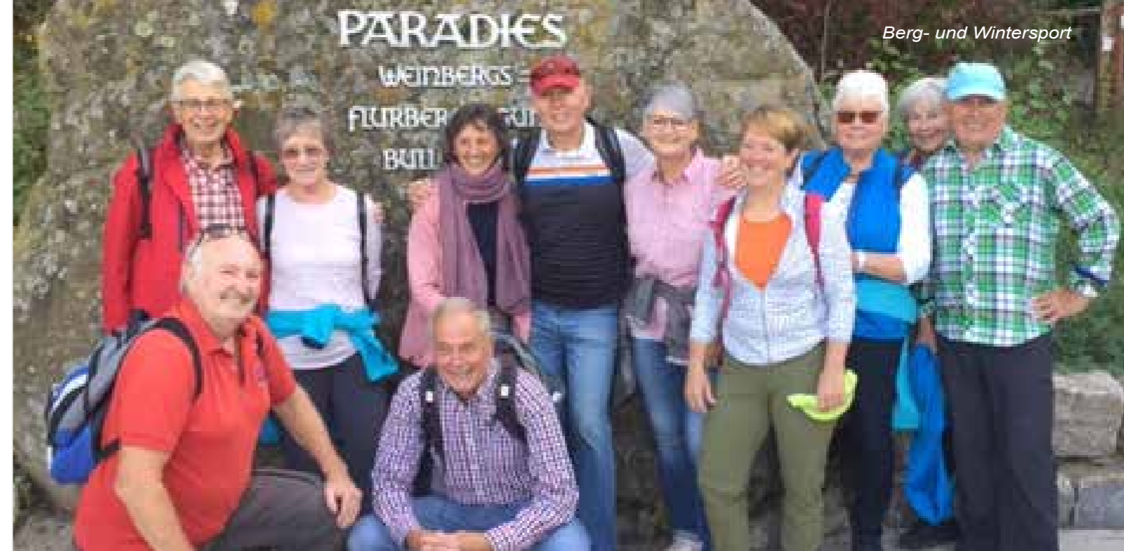
Weinfahrt nach Seinsheim

Bei einem gemeinsamen Abendessen, begleitet von unwetterartigen Regengüssen mit einem starken Gewitter, wurde dieser gesellige Tag beendet.