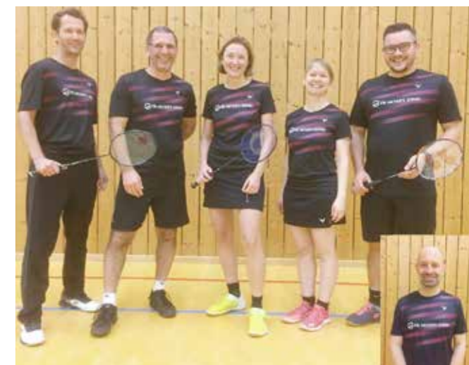
Die zweite Mannschaft der Spielgemeinschaft in vollem Glanz